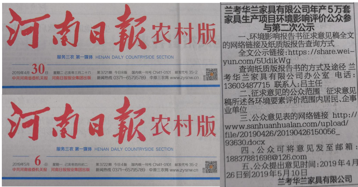
图3 在河南日报农村版刊登本项目环境影响评价第二次信息公告

建设单位分别于2019年4月30日和2019年5月6日在河南日报农村版刊登了本项目第二次环境信息公告。