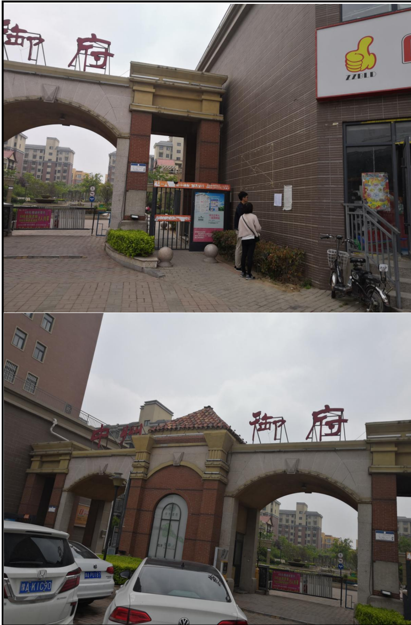
中州御府小区现场公示现场公告