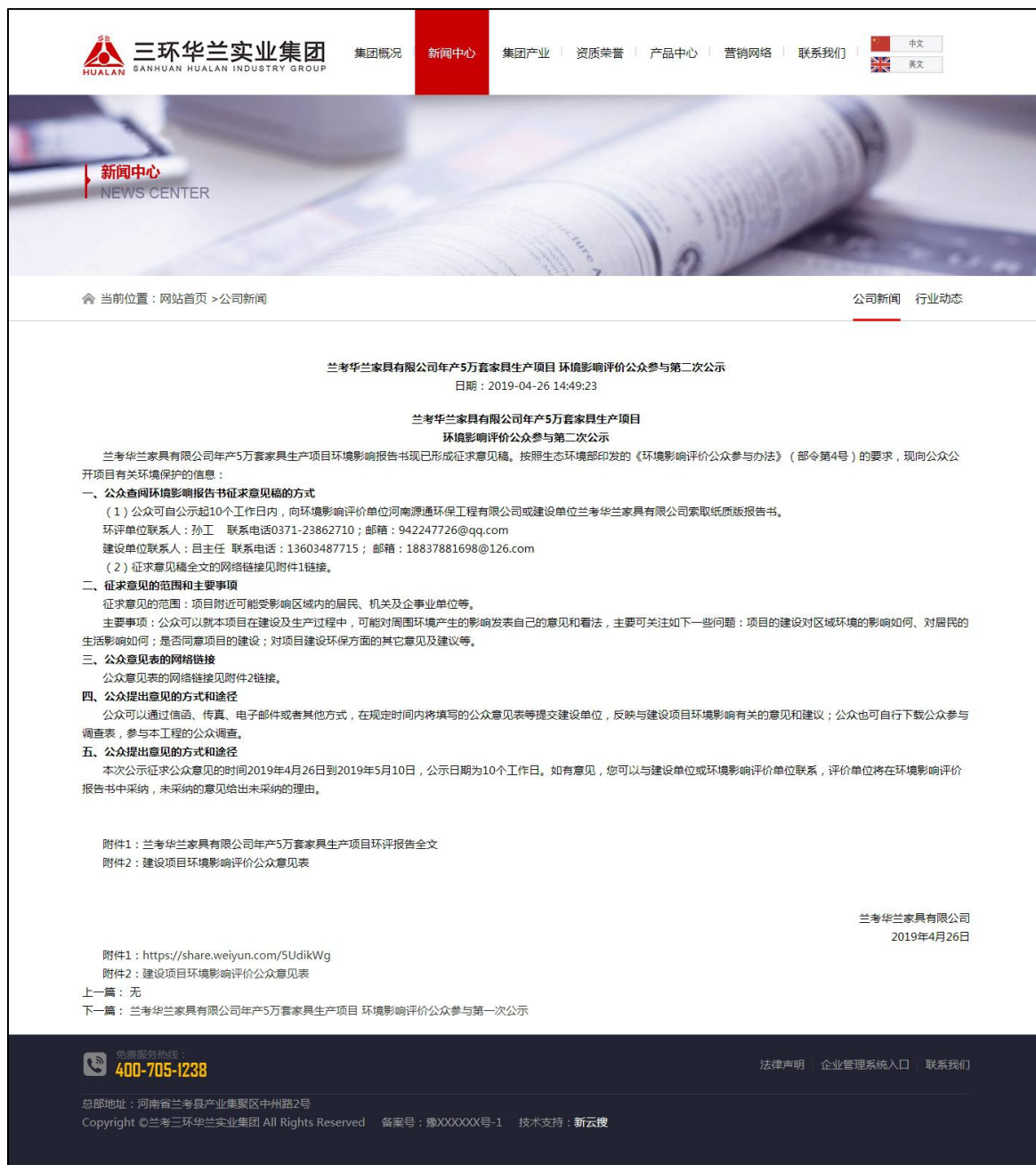
图2 本项目环境影响第二次网络信息公告